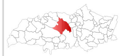
LOCALIZAÇÃO DO MUNICÍPIO DE UBERLÂNDIA NO TRIÂNGULO MINEIRO ESCALA