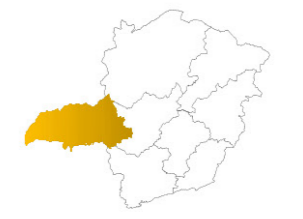
LOCALIZAÇÃO DO TRIÂNGULO MINEIRO NO ESTADO DE MINAS GERAIS ESCALA